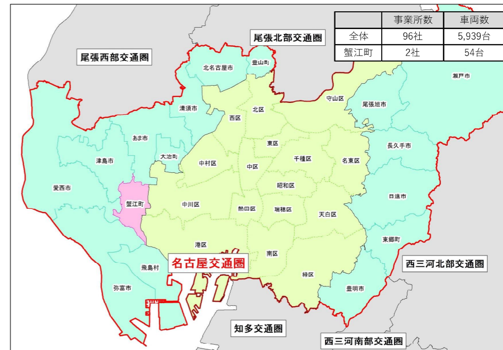
図 名古屋交通圏の営業圏域と事業所・車両数

本町は名古屋市を含む12市4町1村の名古屋交通圏に属している。名古屋交通圏全体の事業所数は96社で、保有している車両は5,939台である。その内、町内に事業所を有しているのは2社で、計54台の車両を有している。