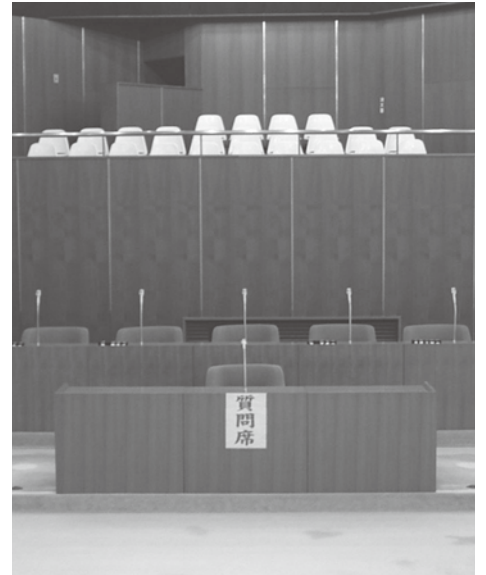
▲議会基本条例でより良い議会を

問 議会基本条例は、議会改革として議会の基本理念や基本原則を定め、住民の議会参加機会の保証・議会審議のあり方・議会と首長の関係・議会組織等を条例化したものである。 問 条例で議案提出に説明資料をつけ、議論しやすくしている自治体がある。蟹江町の現在と比較してどうか。