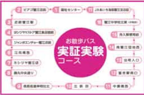
▲変更後の路線図(上)と実証実験コースの路線図(右)

軽に外出できる機会の創出などのニーズが高くなっております。高齢者の外出機会の拡大による健康増進、商業施設をはじめとする各施設の利用促進や地域活性化を図るため、町内の団地と大型小売店舗を組み入れた全町の移動を可能とするコースを新たに設け、需給関係や費用対効果、課題などを実証実験により検証し、本格路線化に向けた実施可否の判断材料とするものです。