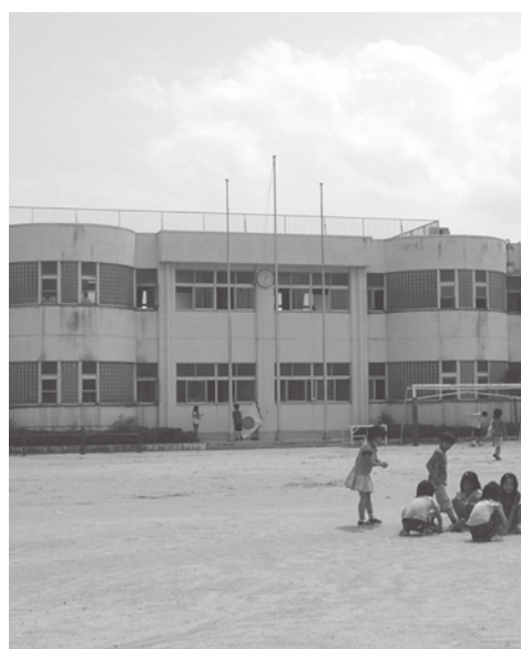
▲校庭で遊ぶ児童（舟入小学校）

問 人口減少時代を迎え、文部科学省も新しい義務教育モデルの研究に乗り出している。本町も学区再編成や統合の議論が行われている。議論は費用対効果と立地環境による住民感情が中心に展開していると思われる。