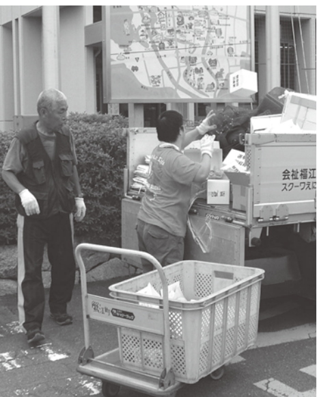
▲古紙回収作業をするワークスの方々

問 自宅介護をしている方の高齢化が進み、先に死を迎え、後に残された者の面倒を見る