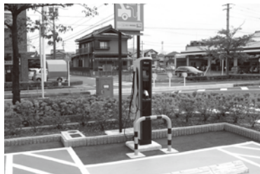
▲電気自動車用急速充電器 (ピアゴ蟹江店)

危険物の規制に関する政令の一部改正等により、電気自動車用の急速充電設備が対象火気設備等に、また炭酸ナトリウム過酸化水素付加物が危険物に追加されたことに伴い、改正するものです。