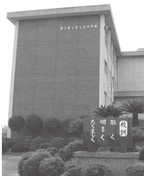
▲蟹江北中学校の自転車通学はどうなるのか