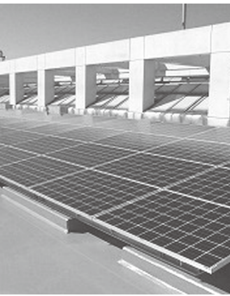
▲学校に太陽光発電の導入を（イメージ）

授業を行っており、ボール運動、水泳、リズム運動などは低学年、中学年、高学年と合同での体育を行っているが、同学年同士での体育はできていない。ボール運動のように人数が集まって一つの種目を行うことに対しては