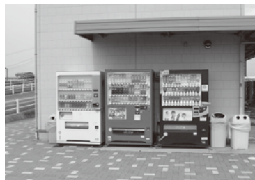
▲日光川ウォーターパークに設置された自動販売機

自動販売機その他これに類するものを設置する場合、使用料として徴収し、経済的価値観に見合った料金の見直しを図るために改正するものです。