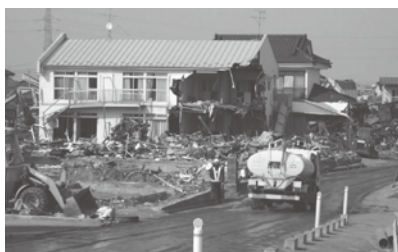
▲東日本大震災で被害を受けた住宅

地方税法等の一部改正に伴い、東日本大震災により被災された方に対する、被災居住用財産の敷地に係る譲渡期限の延長(4年延長)の特例を定めるものです。 (4月1日から適用)