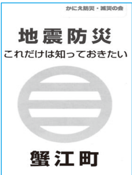
▲新たな防災手帳を配布せよ