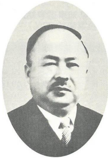
イ くわはらみきね 桑原幹根 ( あいちけんちじ 愛知県知事)

(『歴代内閣首相事典』鳥海靖 編 吉川弘文館 2009 年 (平成21年)より)