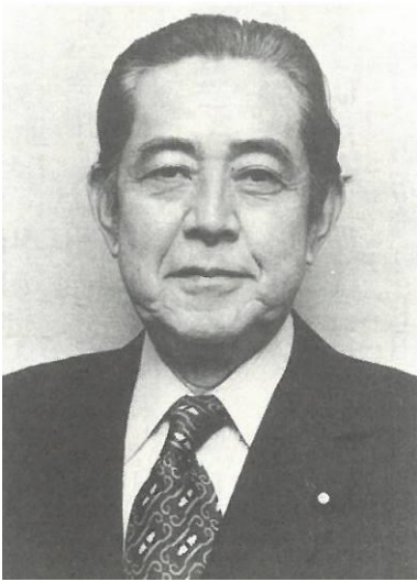
ア さとうえいさく 佐藤栄作 ( しゅしやう 首相)

(『歴代内閣首相事典』鳥海靖 編 吉川弘文館 2009 年 (平成21年)より)