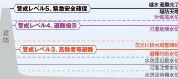
堤防高と水位の関係図

避難が危険と判断された場合は、命を守る最善の行動を取ります。この間に「浸透破壊」や「浸食破壊」の危険性のある異常が発見された場合は状況等に応じて警戒レベル4、避難指示が発令されます。