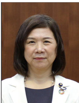
やまぎし みどり 山岸美登利 (公明党)