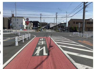
JR蟹江駅北の交差点

また、自動車などの運転者や歩行者など、全ての方の安全性を総合的に判断すると、当該交差点に横断歩道の追加設置はできないとの回答を得た。