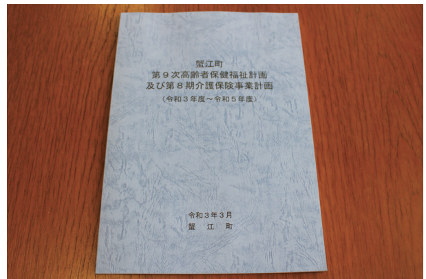
第8期介護保険事業計画(令和3年度～令和5年度)

現在、蟹江町の保険料段階は11段階である。多段階化については、国や近隣自治体の動向を注視し、負担能力に応じた保険料の負担となるよう検討したい。