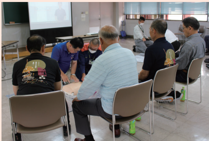
意識の確認から心肺蘇生まで速やかに

6月定例会閉会后、普通救命講習を受講し、心肺蘇生やAED(自動体外式除細動器)の使い方を学びました。救急車が到着するまでの間に何もなかった場合と、心肺蘇生をおこなった場合では、生存率に倍以上の違いがあります。もし、緊急を要する事態に遭遇した場合には、勇気を持って行動することが大切であると学びました。