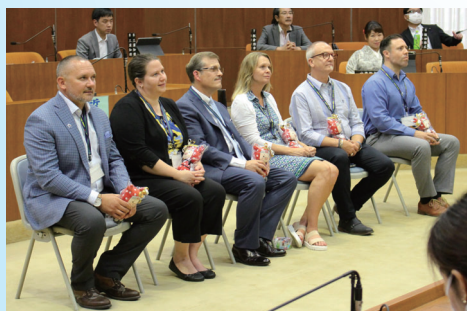
ようこそ蟹江町へ