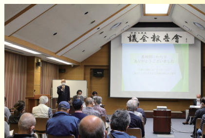
昨年の議会報告会の様子