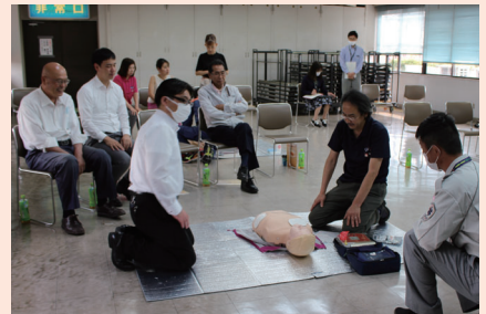
周囲と連携して行動をとることが大切です