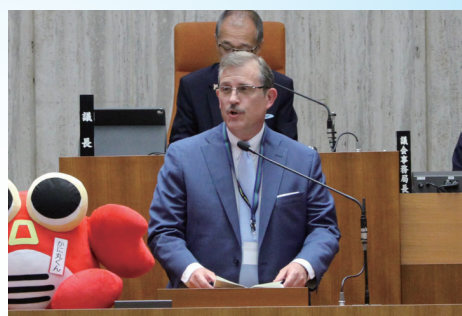
アブシャー市長によるスピーチ