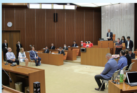
水野議長による歓迎のあいさつ

当日は、アブシャー市長のあいさつ、ギフト交換などを行い、最後に記念撮影(表紙写真)を行いました。