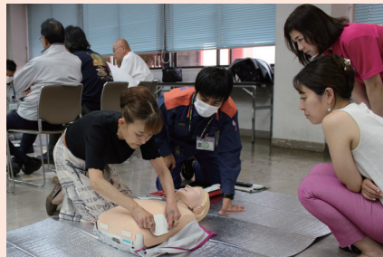
AED(自動体外式除細動器)の使い方を学ぶ