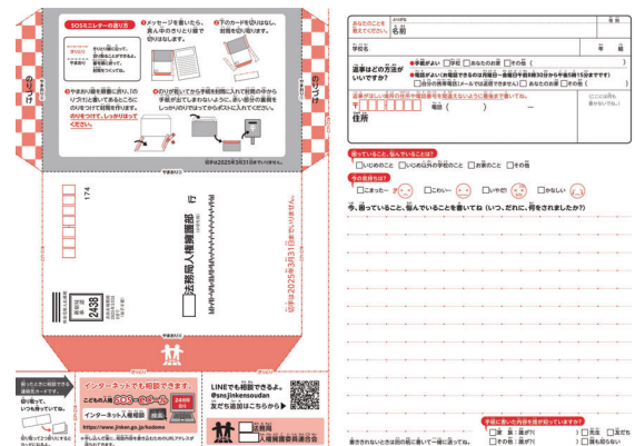
こどもの人権SOSミニレター(小学生版) ※法務省ホームページから掲載

学校としては、「気づき」「声かけ」「傾聴」「つなぐ」「見守る」を丁寧に対応することで、小中学生の自殺予防対策を行っている。