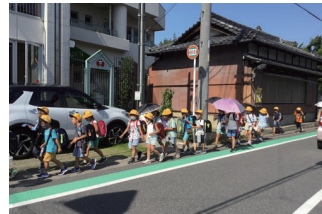
学童への集団登所の様子

③児童の安全面の観点から、大人の方の送迎が必要であると判断し、お願いしている。平日については、ボランティアによる見守り活動の下、小学校からの集団下校により登所している。休学期間は、集団下校や見守り活動がないことから安全確保が十分にできず、児童のみで登降所を行うには危険が伴う場合があると考えます。