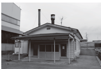
▲老朽化が進む本町斎苑