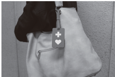
▲町が配布している「ヘルプマーク」

「ヘルプマーク」は平成30年度から配布しているが、「ヘルプカード」は現在導入していない。災害はいつ起こるか分からず、夜間であれば、蓄光はとても便利であると考えられる。今後検討していく必要がある。