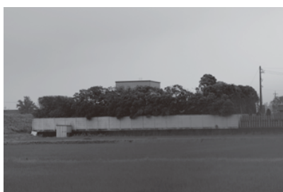
▲一本化が計画される舟入斎苑

くさんの制限がある中で、斎苑一本化の話ができるようになったため、まずは基本計画の策定から始め、供用開始に至るまで、4年から5年かかるのではないかと。