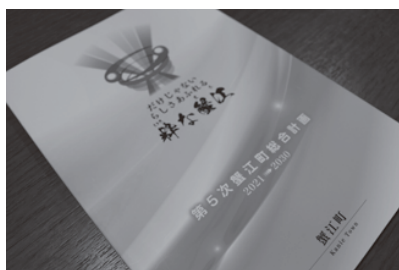
▲より良い蟹江町へ向けて

厚いまちである。何百年以上も栄えてきた商家や、水運で栄えたまち並み等が、未来永劫発展できるような、それを支える人情深い人がたくさん住んでいるまちが「粹な蟹江(まち)」であると考え、「粹」という言葉を使った。