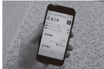
▲進む社会に取り残さないために

問 保育所の育休退園制度を廃止し、継続利用できるような多くの要望がある。今後、廃止への考えはあるか。