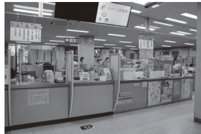
▲煩雑な手続きの解消へ

問 文化財は常に被災のリスクにさらされている。被災時に早急に復元できるように、町内の文化財資料を写真や映像で記録する「デジタルアーカイブ事業」を開始してはどうか。