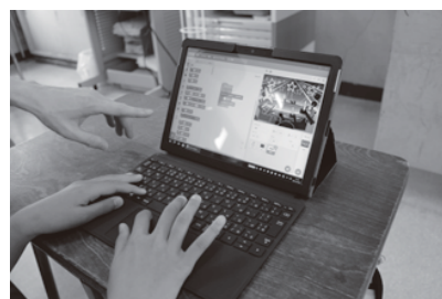
▲タブレットを使った効果的な学習を