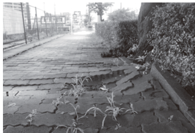
▲危険な歩道の早期修繕を

このことについては、非常に危惧している。温泉通りについては、桜が老朽化し、倒木の恐れがあったため、若木と交換した。その際に、根が相当張っていた。一度にはできないが、至急対応したい。