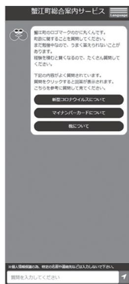
▲町のAIチャットボット

ばどうなるかということが見通せない。また、ソフトは永久的なものではなく、日々新しいものへと変化していく。一つのパッケージであればいいが、法律改正時の対応により、費用対効果として財政負担がどれだけになるかを、しっかりと考えて進めなければいけないと考える。しかしながら、ワンストップにより住民が安心して手続きができるよう整備していくことが、地方自治体の責務であると考え、国・県と情報連携を取りながら、進めたい。