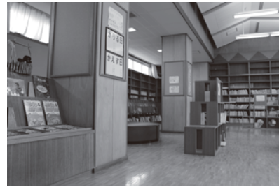
▲学校図書室の利便性向上を

るようになる。そうなれば、学校司書の必要性も出てくると考えられる。教育委員会とも相談しながら検討したい。