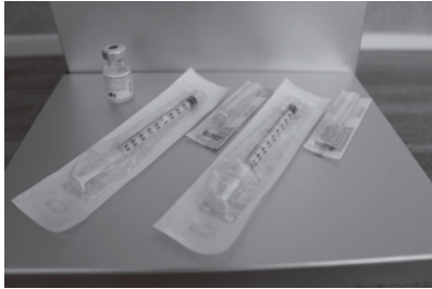
▲進むワクチン接種

問 新型コロナウイルス感染症対策において「コロナ封じ込め」という目標で、ワクチン接種とPCR検査を同時並行で行う考えはないのか。