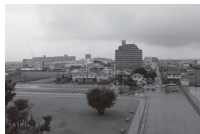
▲希望の丘広場から富吉駅周辺を臨む

一方、土地区画整理事業も地域の再利用、活性化に不可欠であると考え。地権者の同意を得ながら、県に承認を得て、町民の皆様の貴重な税金を相当額要する。財政バランスを考慮して、行政をしっかりと進めていく必要がある。