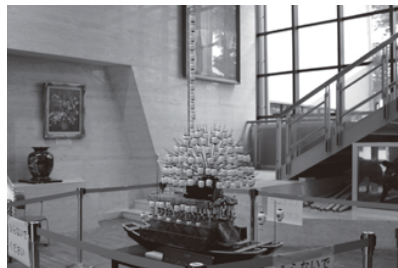
▲文化・伝統を未来へ

だと考える。須成祭は、文書とデジタル画像で記録を残すことで国の重要文化財に指定され、最終的にはユネスコ無形文化遺産への登録に繋がった。他にも町には文化・伝統があるため、それらを含め前向きに進めたい。