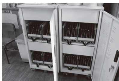
▲タブレットを正しく使うために

ンテンツが少ないというデメリットもある。コロナ禍において、「非接触」の重要性は高い。時間がかかるが、他の自治体の状況を見ながら進めたい。