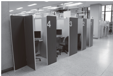
▲役場1階の受付カウンター

当町のマイナンバーカードの交付率は約33パーセントである。交付率が低いのは、セキュリティへの不安が原因であるとともに、利用方法が明確化されていないことも考えられる。手続きにあたっては、個人情報保護のため、プライバシーを守ることもができるように受付を整備した。セキュリティ対策を十分に考えた上で、マイナンバーカードの普及を図りたい。