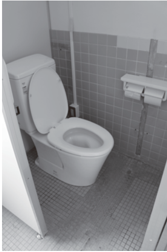
▲進む学校トイレの洋式化 (学戸小学校)