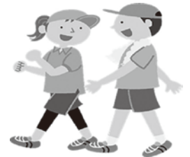
(アクティブガイド、令和元年国民健康・栄養調査)