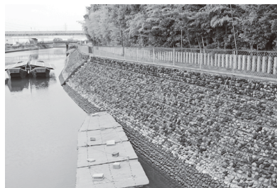
▶整備が進む堤防沿い

問 この先人口減少傾向に向かい、税収も減少することが予想されるが、何か施策はあるのか。