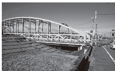
▲木曾川にかかる尾張大橋

従来のハザードマップはおおよそ100年に1度の大雨を前提とした「計画規模(L1)」を基に作成されていました。近年の自然災害の激甚化を受けて、おおよそ1,000年に1度の大雨等を想定した「想定最大規模(L2)」での浸水想定へ見直すこととなりました。