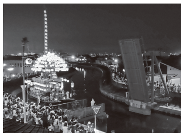
▶ユネスコ無形文化遺産の須成祭

舟の出入りが盛んで、歴史・文化の深い舟入地区、須成祭を中心とした古い町並み、伝統をそれぞれの地域で守っていくことが必要である。