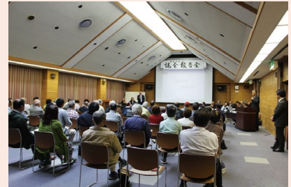
▲昨年の報告会の様子

※新型コロナウイルス感染症拡大等の状況により、中止を含めて予定が変更になる可能性がありますのでご了承ください。最新の情報は町議会ホームページをご覧ください。