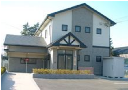
新たに建設された学戸学童保育所