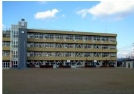
大規模改修工事が完了した新蟹江小学校